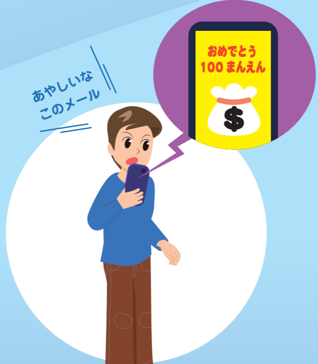
あやしいじょうほうにちゅういする