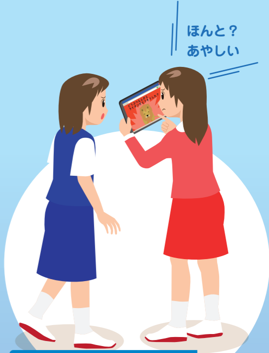
ネットのじょうほうを すべてはしんようしない