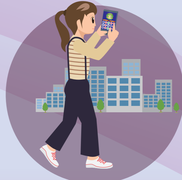
あるきながらスマホをみる