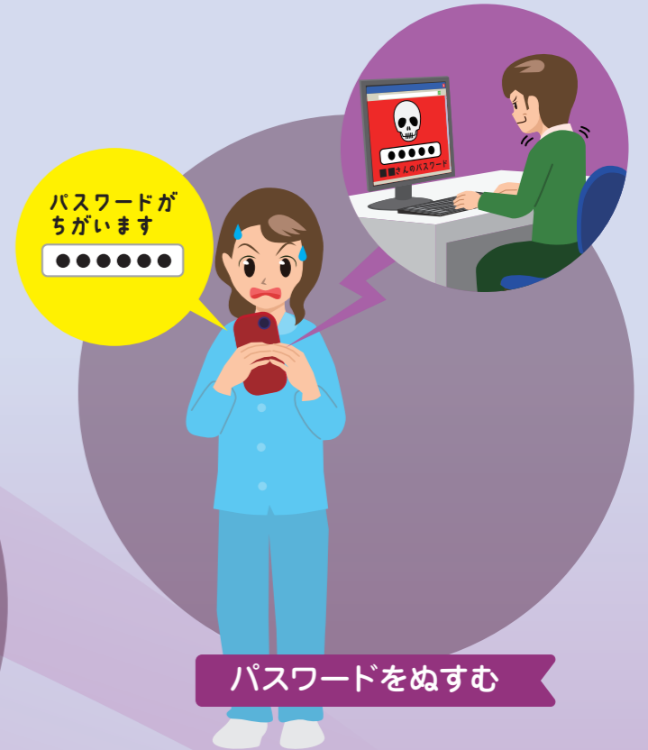
パスワードをぬすむ