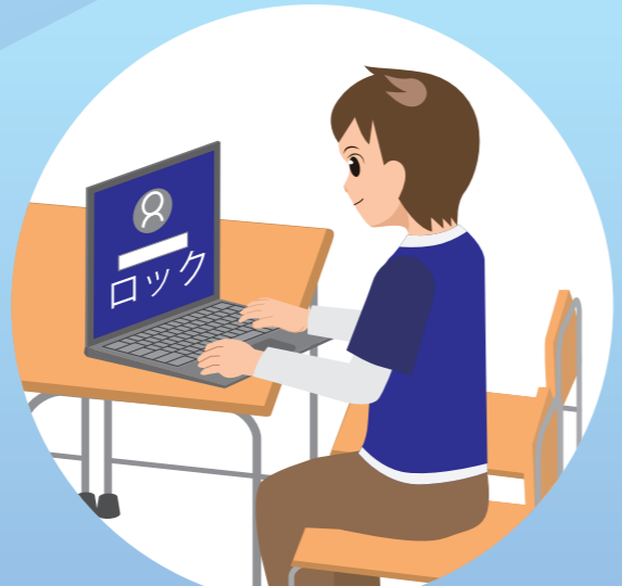
せきをはなれるときはがめんをロック