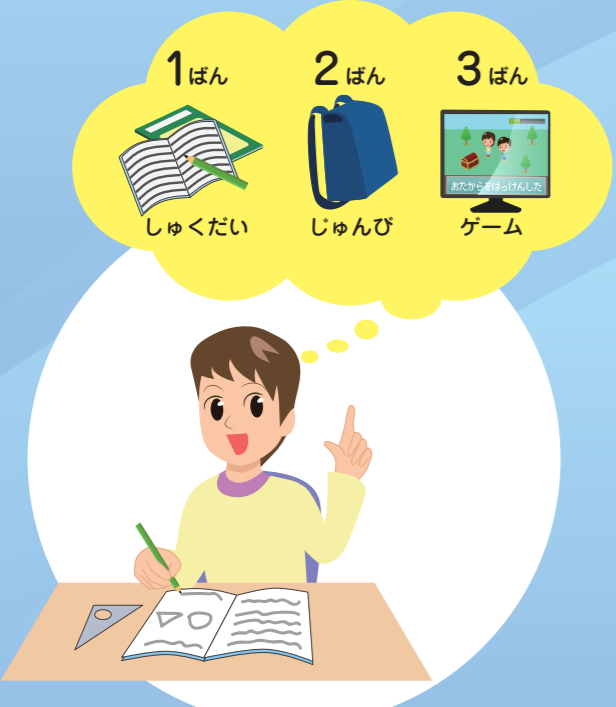
つかいかたのルールをきめる