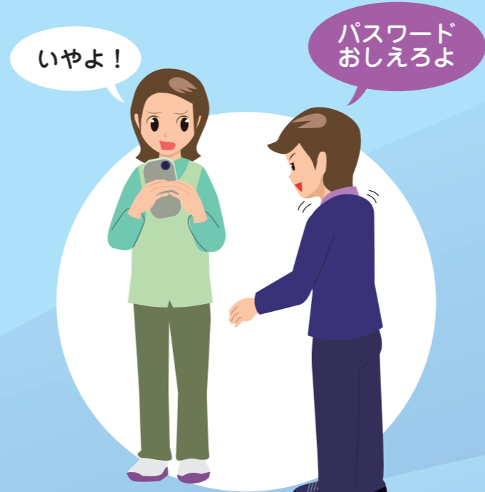
パスワードをおしえない