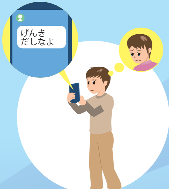
ともだちへやさしいことばをおくる