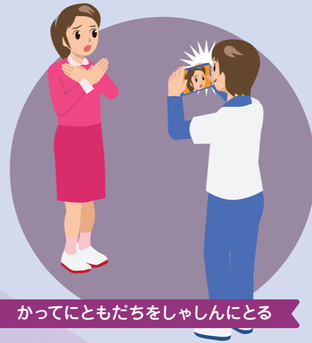
かってにともだちをしゃしんにとる