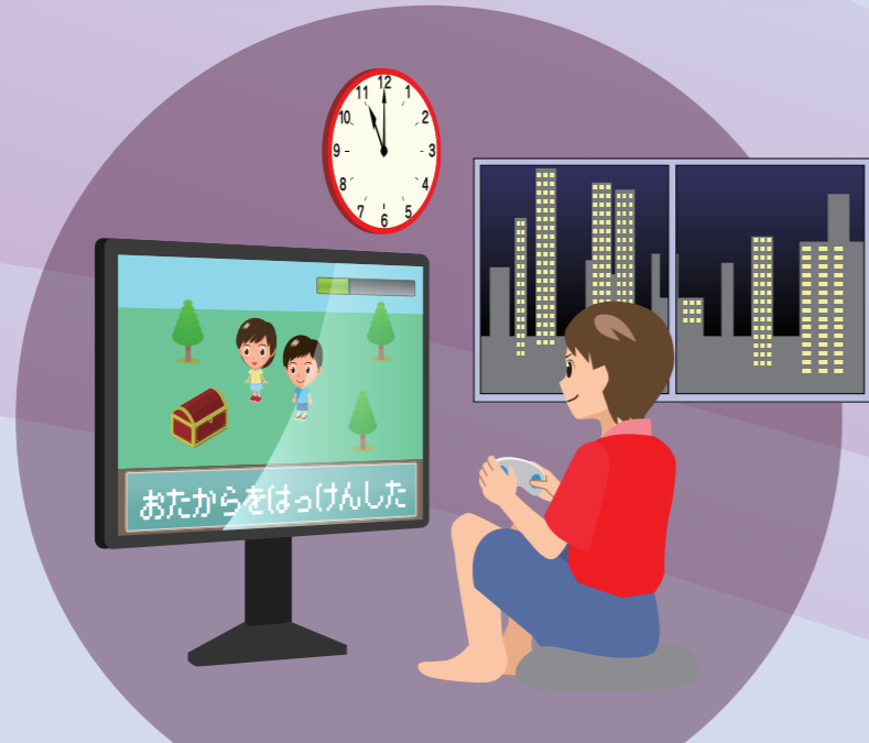
あそぶじかんをきめずゲームしつづける