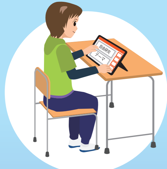
がくしゅうにかつようする