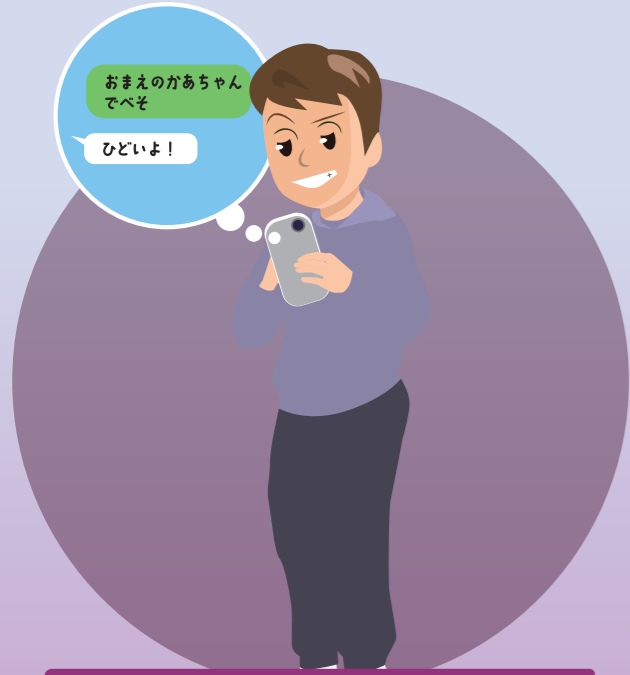
きずつけるメッセージをおくる