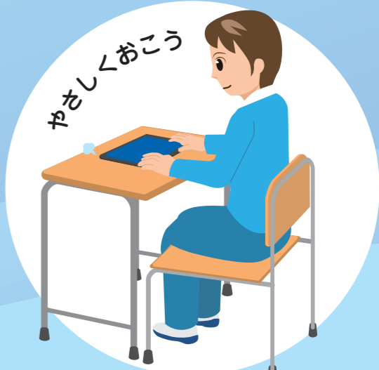
たんまつはたいせつにする